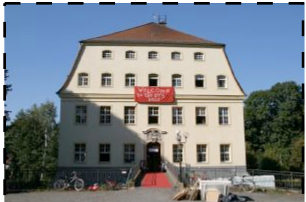
Unser Zentrum in Herrnhut