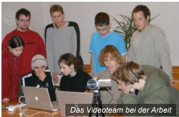
Das Videoteam bei der Arbeit

... ist die Medienarbeit. Ich bin zuständig für unsere Videoarbeit. Mit meinem internationalen Team mache ich Videos über unser Zentrum, über unsere Schulen und Einsätze und natürlich über unsere langzeitliche Arbeit im Ausland. Durch diese Videos kann sich jeder ein klares Bild von unserer Arbeit und auch von Mission ganz allgemein verschaffen und unsere Studenten, denen wir eine DVD schicken wenn sie sich anmelden, sehen was sie erwartet. Einige von ihnen sind unter anderem auch hier, weil sie eines unserer Videos angesprochen hat.